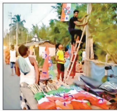
কাথির নামলে দলীয় পতাকা লাগানোর কাজ করছেন তৃণমূল কর্মীরা।

এবার তৃণমূল 'নব জোয়ার' জনসংযোগ যাত্রায় পূর্ব মেদিনীপুরে প্রবেশ করবেন তৃণমূলের সর্বভারতীয় সাধারণ সম্পাদক অভিষেক বানার্জি।